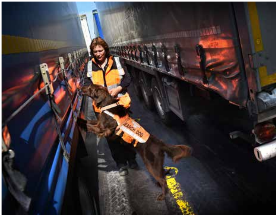
Politiediensten kunnen voor het inzetten van speurhonden en technische middelen een beroep doen op derden.