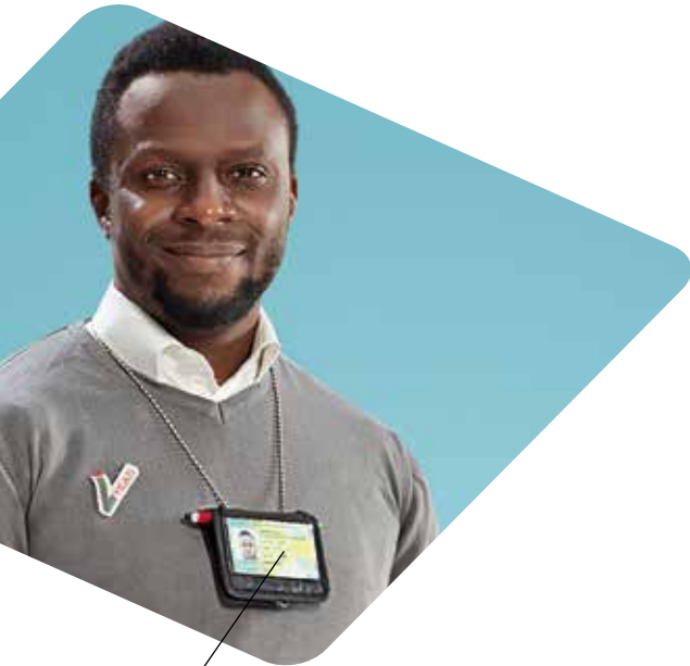
Bewakingsagent draagt zijn identificatiekaart zichtbaar en draagt een onderscheidend uniform met het Vigilis-logo.

We zijn ervan overtuigd dat de combinatie van traditionele inspecties en een preventieve aanpak een veilige en professionele omgeving binnen de sector van de private veiligheid bevordert.