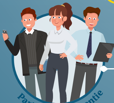
Partners in preventie